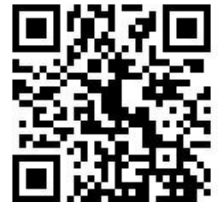
申込フォームはこちら