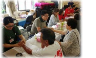
アロマハンドケア&マッサージコーナー。良い香りの中、おしゃべりが弾みます。