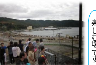
女川港の護岸工事もまだまだ進んでいません