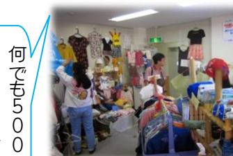
「東日本大震災圏域創生NPOセンター」運営の「500縁シヨップ」