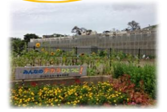
石巻市立旧門脇小学校グラウンド傍の花壇にはたくさんの花が植えられていました。

1日目 見学地：『がんばろう！石巻』の看板、石巻市立旧門脇小学校、石ノ森萬画館、女川町、石巻市雄勝地区、石巻市立大川小学校、良葉東部（イーハトーブ）野菜工場