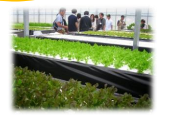
石巻市立大川中学校跡地に建設され、地元大川地区の人々が働いています。