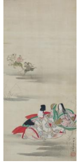
貴美人図 月岡雪鼎筆 個人蔵

近江に生まれ、江戸時代中期の大坂で活躍した月岡雪鼎（せつてい）。色白で鼻筋の通った瓜実顔の美人画は、当時の大坂や京都の裕福な人々に愛され、今もなお国内外で高い評価を受けています。美人画を得意とした月岡雪斎ら、多数の門人がその後を継ぎました。展示会では、雪鼎の多彩な作品と共に、その門人や孫弟子の作品も展示しています。