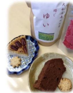
自然の恵みで作られた 奈良のお茶「ゆい」

運営スタッフも自主避難者です。震災後ずっと気を張り続けてきたお母さんお父さん、子供達も。ここには仲間が沢山います。愚痴ってもいいよ。泣いてもいいよ。仲間と一緒に心のデトックスして、みんなからパワーを頂いて、またたくさん笑いましょう。避難者じゃなくても、この国でどうしたら安全に暮らしていけるか考えている方も、是非いらしてください。この場所で、普段できない話ができると思います。あなたとお逢いできる日を、楽しみにお待ちしております。