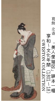
葛飾北斎「美人愛猫図」(1801-18)

江戸初期から明治の絵師、約50人による多彩な作品が、日本に里帰りしての初公開となります。