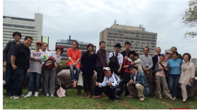
東北県人会×ろくな者じゃの会

長雨の中、炎天下となった4月4日、大阪城豊国神社南裏堀で、東北県人会の観桜会が開かれました。これは冬季にホームレスへ寝袋配付の活動をされている「ろくなもんじゃの会」のイベントに参加させていただいたもの。