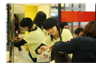
チャリティーでも妥協はしません!

2月のホッとネットおおさか定期便のちらしにて、避難者の方にカットとライブのご招待をいただいた「第5回 AVa+チャリティーイベント」。(第4回の模様は、本誌第35号に掲載)