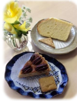
安心材料を使っている 手作りケーキ

震災をきっかけに、東北関東から奈良近郊へ避難されてきた方々を中心として、月に一回、「ツキイチ・カフェ」を開催しています（詳細は右下参照）。美味しいお菓子と無農薬・無化学肥料で育った奈良のお茶を頂きながら、のんびりおしゃべりしましょう。