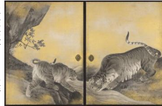
重要文化財「遊虎図」(部分) 山本虎幸 天明7年(1787)

旅行が禁止されていた江戸時代、例外的に許された神仏への参拝は、庶民にとって一生に一度の夢でした。こんぴら参りはお伊勢参りと並んで、一大ブームに。以降、数多くの宝物が奉納され、現在では膨大な数の文化財が収蔵されています。その珠玉のコレクション一挙公開の展覧会です。