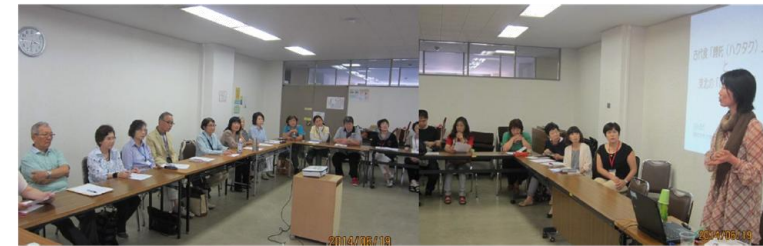
古代食『ハクタク』と東北の『はっと料理』をテーマに交流

NPO 法人大阪府高齢者大学校は、高齢化社会をより明るくする責任と義務を果たすことで、高齢者による高齢者のための学習機関として2009年4月にスタートさせ、2015年4月から7期生2500名の受講生を迎え、全64クラス(科目)で、楽しく学習し、新たな仲間をつくり、趣味深め・広め、社会参加活動に取り組んでいます。2013年4月には東日本被災者支援大学校を立ち上げ、関西に在住されている被災避難者に無料で入学頂き、一般受講生と共にアクティブシニアの活動に取り組んでいます。今年度は38歳から80歳の12名の方が、『国際文化交流科』『シニアの健康と医療を易しく学ぶ科』『英会話交流を楽しく学ぶ科』『大阪の史跡探訪科』『現代社会を考える科』に入学されました。