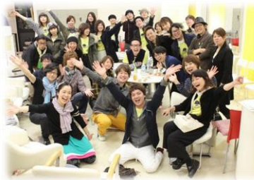
みんな楽しめました♪

した。美容師ができる復興支援で“チャリティーをしよう!”と始まったこのイベント。チャリティーカットのほか、バザーやオーガニックカフェ、マッサージにジャズライブもありました。