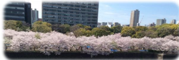
この桜を見ながら…

中国人の小学生から、70歳代の長老まで総勢30人を超える参加者でにぎわいました。堀の向こうの一面の桜を愛でながらの交流会でした。