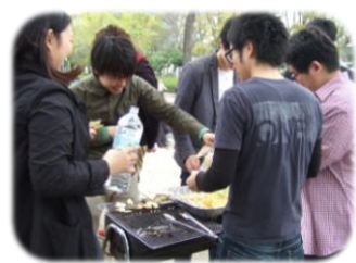
レオクラブの大学生達

3年前から皆様と交流をさせていただいております。今後も少しでも皆様のお力になれば幸いです。