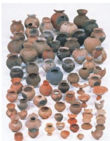
周溝墓・古墳出土の土器 (平野区加美遺跡 弥生時代終末期～古墳時代初頭)

平成26年に行われた大阪市内の遺跡発掘調査のうち、長原遺跡や中之島蔵屋敷跡における主要な成果を、約250点の出土資料と発掘現場の写真パネルで紹介いたします。また、加美遺跡で見つかった弥生時代終末期～古墳時代の多量の土器や、縄文時代の資料もまとめて展示します。