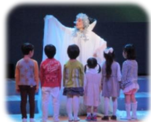
子どもを呼び寄せる女王

地上を放射能で汚す大人たちに怒る雪の女王は、未来の子ども達を守ろうとさらいま。彼らを救おうと北へ旅に出る大人達。道中、各々自分がすべきこと、大切なものは何かを気付いてゆきます。テーマは壮大ですが、歌あり笑いありで誰もが楽しめる内容でした。