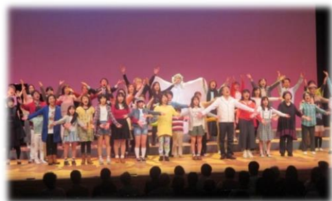
雪の女王の心も溶かす あたたかいエンディング

4月2日、コーラスミュージカル「雪の女王」が、芦屋市民センターで公演されました。「今を、未来を乗り越える力」にと、主催者が願う舞台には、東日本大震災の被災者や避難者も共に出演しました。