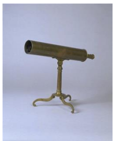
反射式望遠鏡 江戸時代後期 本館蔵(羽間平安氏寄贈)

江戸時代の天文暦学の発展に多大な貢献をした大坂の町人天文学者・間重富。その関係資料が、このほど重要文化財指定となる予定です。