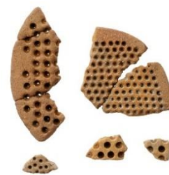
ガラス小玉鋳型 古墳時代中期から飛鳥時代 大阪文化財研究所保管

645年、難波遷都が行われた大阪の上町台地北部では、難波宮以前、ガラス製品や鉄製品などの先端技術を駆使した手工業生産の場が拮がっていたことが、発掘により明らかになってきました。