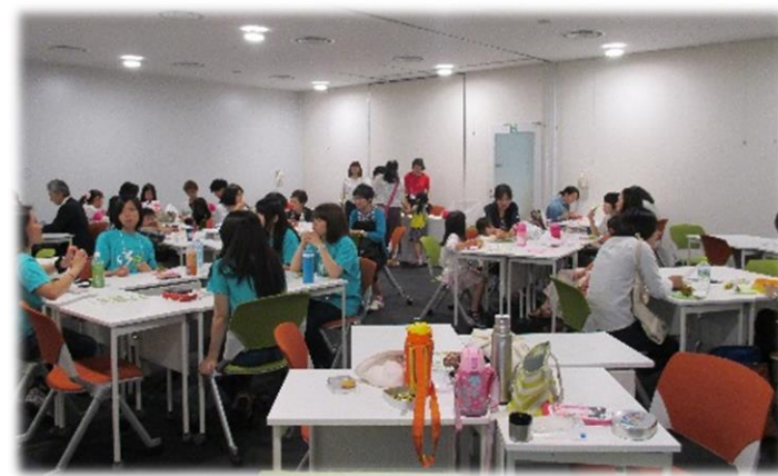
とても保育スタッフが多く、こどものことを気にせず ゆっくり交流、気持ちの整理もできました。(アンケートより)

5月22日(日)大阪府立大学 I-site なんばの2階フロアを借り切って、ホッとネットおおさかの「避難者交流会」を開催しました。平日の交流会に行けない人、ちょっと育児を忘れて大人同士でゆっくり話したい人、すっきりリフレッシュしたい人。避難者同士はもちろん、支援者とも交流できる場となりました。専門的な悩み相談を受ける専門家や保育、日常を忘れてリフレッシュコーナーの担当などは全てボランティア。避難してきたばかりの人のためにと、当事者団体もコーナーを開設しました。交流会の最後には主催代表が「誰もが安心して関西の暮らしを続けられるよう、これからも支援を続けていく」とあいさつをし、終了しました。