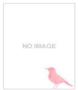
《門世の欄》 昭和43(1968)年 棟方志巧記念館蔵

画家を志し、大正13年、21歳で上京した青森の青年は、版画家として成功、世界のムナカタと呼ばれました。仏教をテーマにした作品や、郷土の青森・東北を題材にした作品を多数残しました。本展では、強烈な個性を発して輝き続けた偉大な版画家の生涯をたどります。