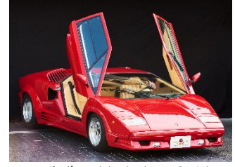
ランボルギーニ カウンタック アニバーサリー

芸術品であり、歴史的背景や物語を有する数々の世界的名車。時代の語り部でもある美しき憧れの名車が、世界遺産の元離宮二条城に勢ぞろいする展覧会です。