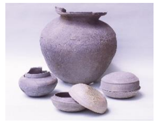
死者に供える食物などを入れていた可能性のある須恵器(すえき)

平成27年度に行われた大阪市内の遺跡発掘調査成果と、豊臣期大坂城の調査成果を合わせ、約200点の出土資料と発掘現場の写真パネルで紹介。