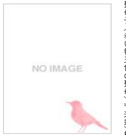
ジョヴァンニ・ベッリニ 聖母子(赤い智天使の聖母) 油彩 板

七宝のように艶やかな色彩の宗教画、詩的な聖母子像など独創的で表現豊かなヴェネツィア派の作品。国内でも前例のない、ヴェネツィア・ルネサンス絵画史を一望できる展覧会です。