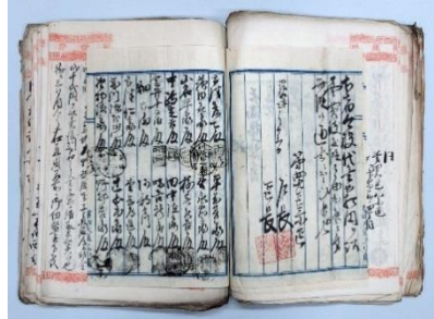
地所家屋譲売買証証図込 明治9年(1876) 本館蔵(野村吉夫氏寄贈)

本展示会では、彼らに関わった事業や団体に関する資料約50点を紹介しながら、近代大阪の名望家の実像や地域社会の実情に迫ります。