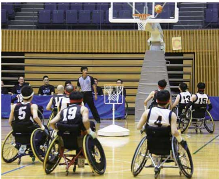
上肢にも障がいがある重度障がい者が参加できるよう考案されたツインバスケットボール