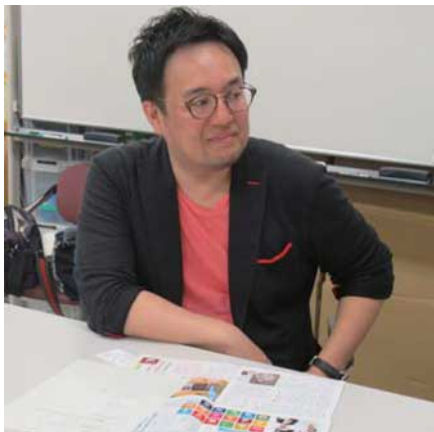
エコトーン 特定非営利活動法人地域環境デザイン研究所 ecotone

私たちが変えられるを合い言葉に「衣・食・住・遊・職」の日常生活を重視したライフスタイルを提案し、大阪を持続可能なまちへと変身させることをめざします。