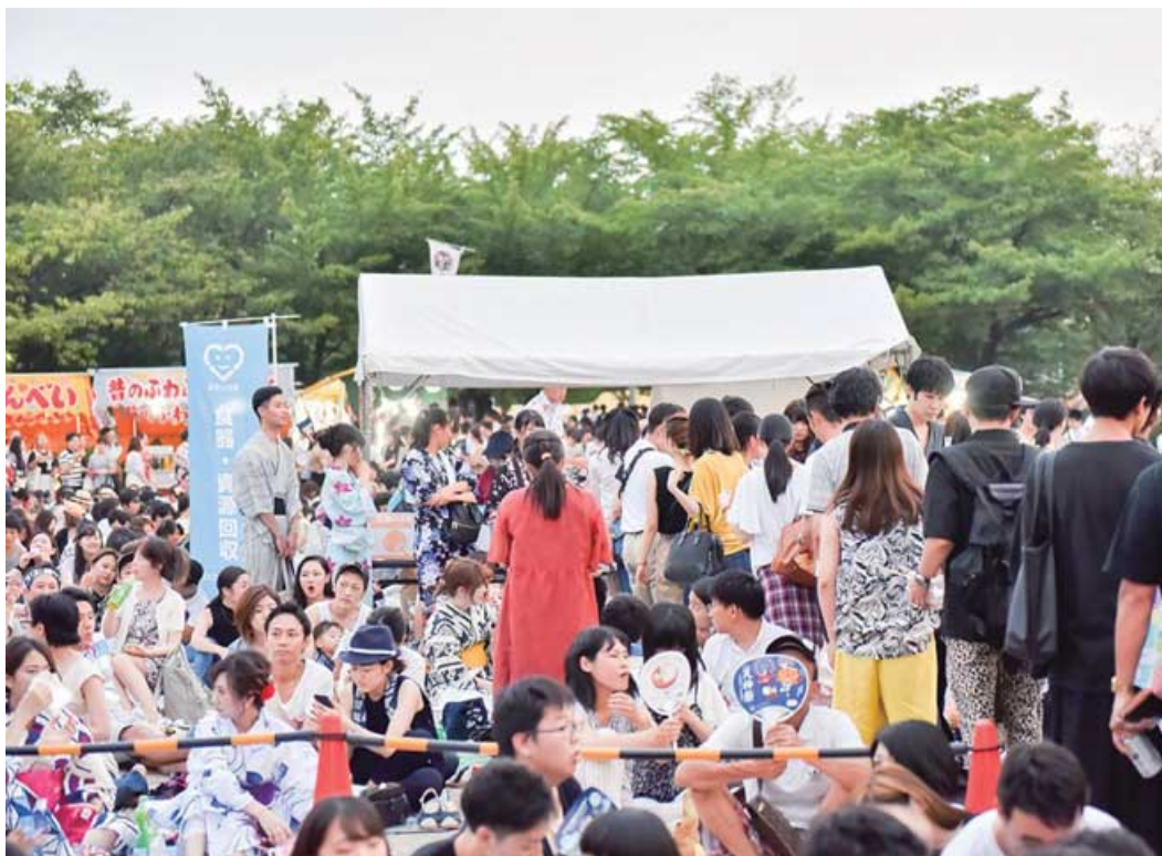
長蛇の列ができるエコステーション

ランティアに参加してもらいました。そのうち、高校生ボランティアが150人以上も参加しています。