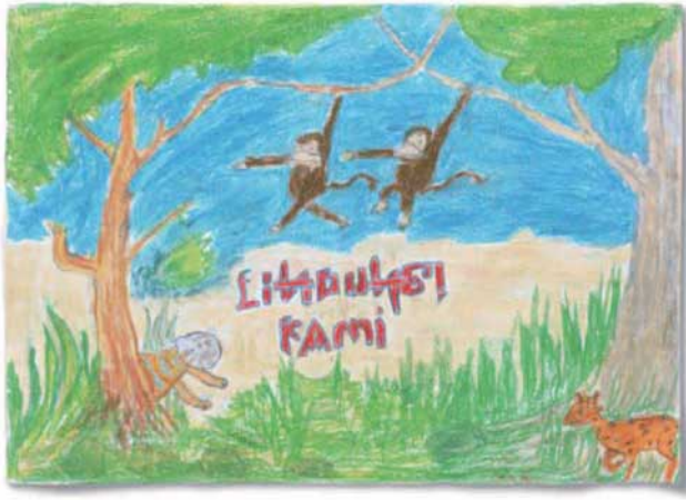
再生プロジェクトを行っているバリヤン地区の小学校の児童から贈られた絵。 「わたしたちを守って!」という動物たちのメッセージをこめて、描いてくれました。