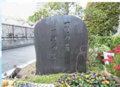
経営理念である「一樹の陰一河の流れ」と書かれた石碑

問合せ 社会福祉法人秀和福祉会 〒538-0051 鶴見区諸口6-2-7 TEL.06-6915-8008