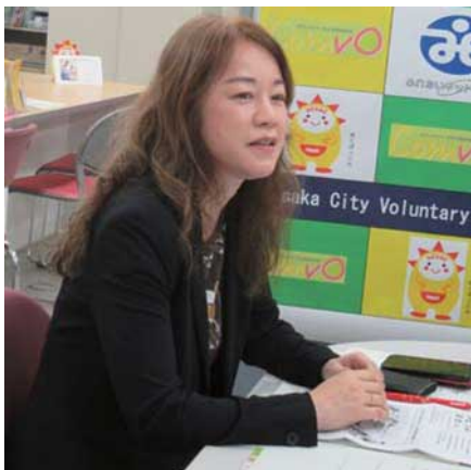
NPO法人ごみゼロネット大阪

地域において、現在の大量生産・大量消費・大量廃棄の社会システムの変革をめざし、ライフスタイルの見直しを図るなど、環境共生型まちづくりを推進しています。