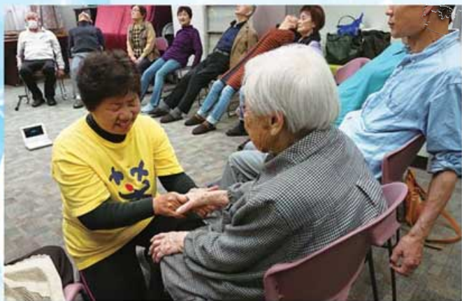
ヨガの講師からリラクゼーションを受ける参加者

4月中旬、社会福祉法人秀和福祉会のケアハウス「グリーンシティー秀和」で、サロンつるみが主催する