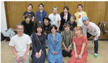
20代から40代までの美容師17人が参加しました

【受託事業者】大阪市ボランティア・市民活動センター(社会福祉法人大阪市社会福祉協議会)