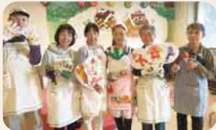
プレイルームに集まって、エプロンシアターをすることも

ボランティアは、かわいの手作りのぬいぐるみ人形や、手製の紙芝居や絵本などを用意して、各病室を訪れます。入院している子どもたちの年齢や特長、