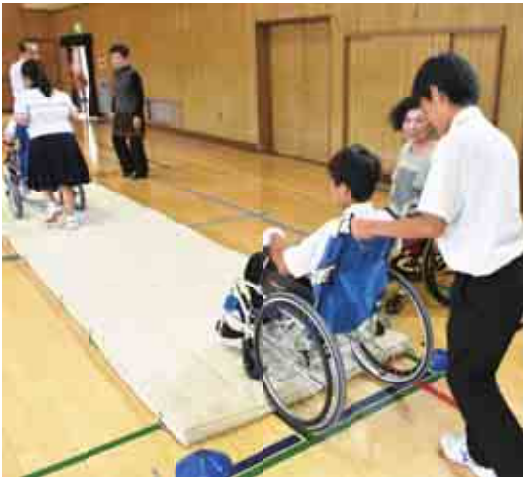
車いす体験を通して経験を伝えます

人の心に明かりをともしれば、おのずと幸せになる気がしています。これが福祉の心だと思います。