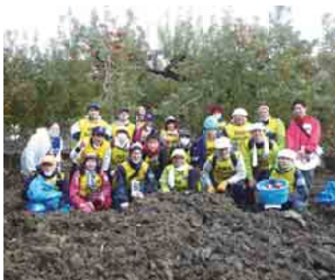
大阪府下からボランティアが集まりました

「家も浸水してしまい家の片づけが大変で畑に行けなかった。ボランティアがいなければ、りんご農園まで手がまわらなかったのでも助かりました」とりんご農家の人からの言葉ももらいました。活動を終えたボランティアからは、「想像していた以上に被害が大きかった」や「りんご農園でいただいたりんごの味が忘れられません」「支援先の方々がこころよく受け入れていただけでよかった」などの声があがりました。