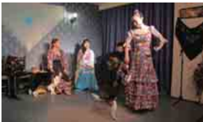
「犬猫茶会ライブ新年会～フラメンコとジャズのマリアージュ～」の様子

特定非営利活動法人ペットライフネットでは高齢で、ペットの行く末を心配する人や、新たにペットを飼う事に躊躇している人を支援しています。例えば、もし、飼い主自身が入院などで飼育困難に陥った場合には、「飼育サポートシテム」により、飼育介助(ペット病院への送り迎え、フードなどの消耗品の