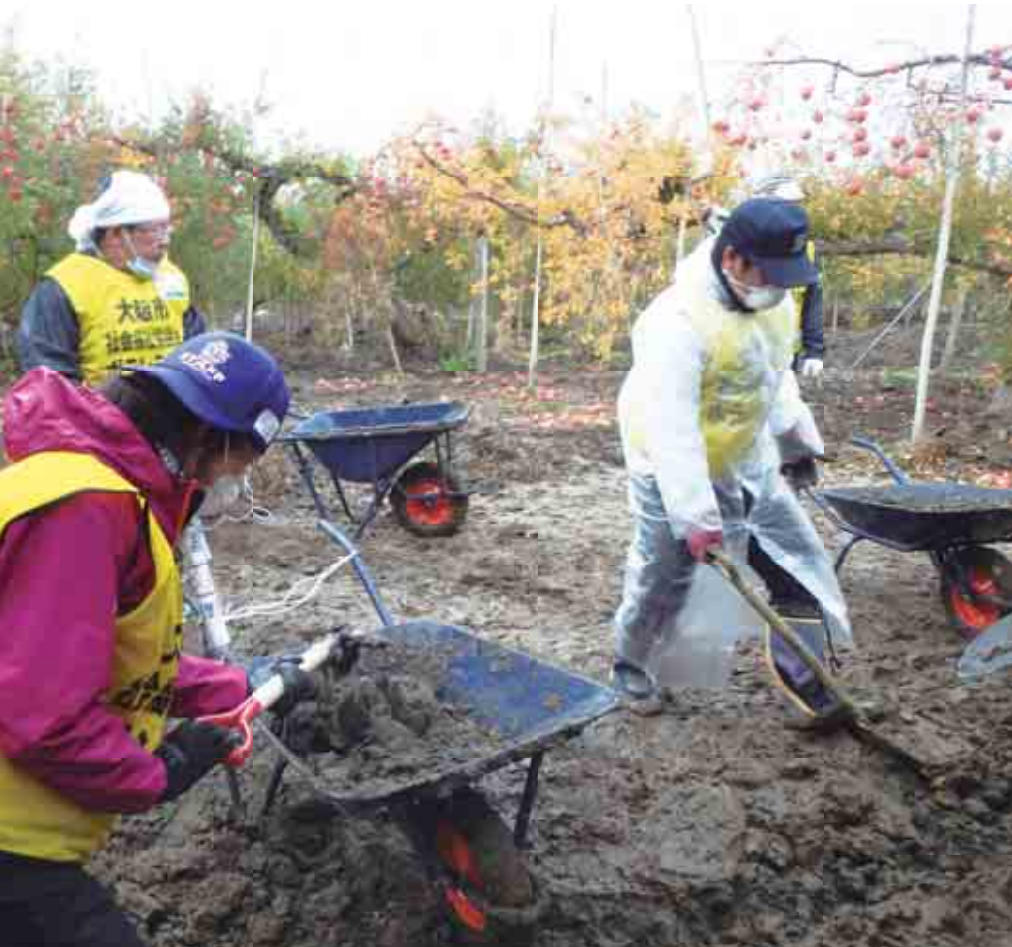
りんご農園に流れ込んだ泥を出すボランティア

もに、10月に発災した台風19号により大きな被害を受けた長野県長野市へ支援に向かいました。