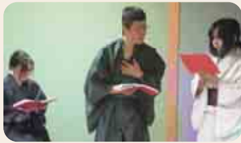
大阪にゆかりのある近松門左衛門作品「曾根崎心中」の朗読演劇をしました

地域の寺社やデパート、病院などへ出向いて、絵本の読み聞かせなどを通して、子どもたちの心を彩り、愉快地楽しく活動している2つのボランティアグループを紹介いたします。