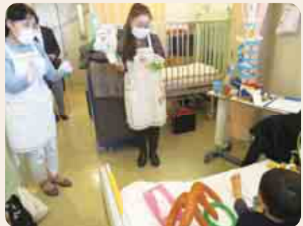
ボランティアが病室に入ると一気に楽しい雰囲気

「キャベツの中から青虫出たよ。『ピーピー』と、軽妙な指人形のリズムに体を動かしたり、飛び出す絵本や紙芝居の語りに、じつと聞き入る子どもたち。ベッドのそばのお母さんからも笑顔がこぼれます。『やつてよかった』と、ボランティアの喜びの瞬間でもあります。只今、一緒に活動いただけるボランティアを募集しています。子どもが好きで、楽しくできる人であれば誰でも歓迎です！是非お問い合わせください。」