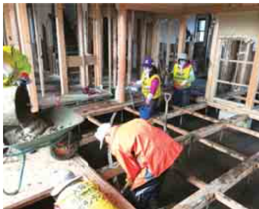
床下の泥をかきだすにはかなりの体力が必要です