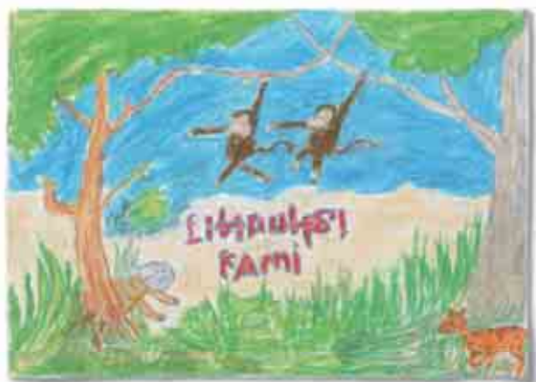
再生プロジェクトを行っているバリヤン地区の小学校の児童から贈られた絵。 「わたしたちを守って!」という動物たちのメッセージをこめて、描いてくれました。