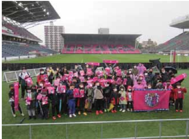
最後にピッチで記念撮影