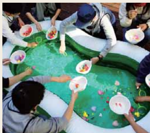
交流会で、楽しく金魚すくい大会