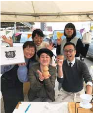
メンバーで『生野プロダクト』をイベント販売

「生野区は、福祉や空き家再生などの住民活動が活発な地域ですが、各団体の連携が十分に取れていないところもあります。『桃谷ロイター』で発信する