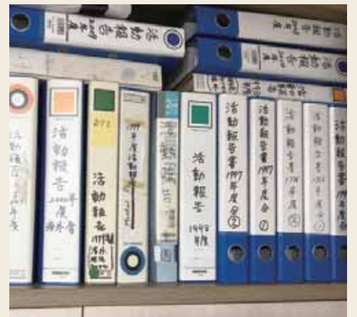
1995年から現在まで、すべての活動記録を保管

さらに全国のボランティア団体と手を結び、旅行など、視覚障がい者の広域な移動を支援するネットワークに参加。