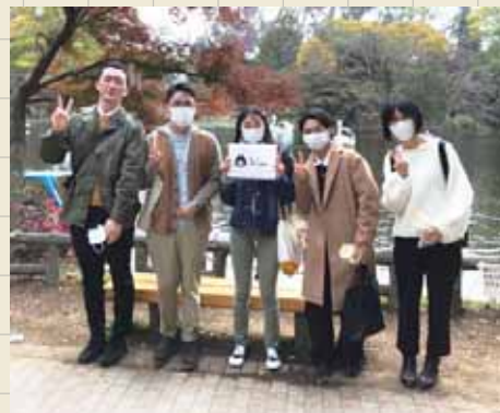
Wisaの活動メンバーたち