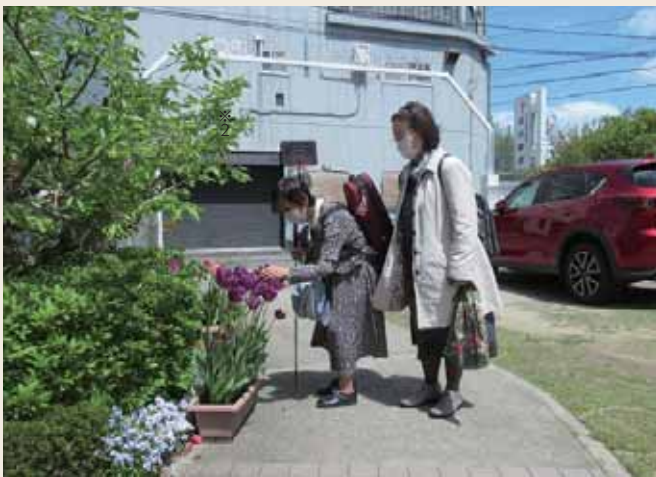
利用者に常に寄り添い、行動を一緒に

男性利用者の同行をされていて、私が男性トイレに入っていくけない時なども、通りすがりの人に声をかけてお願いすると、ほぼ皆さんが快く協力してくださいます。」