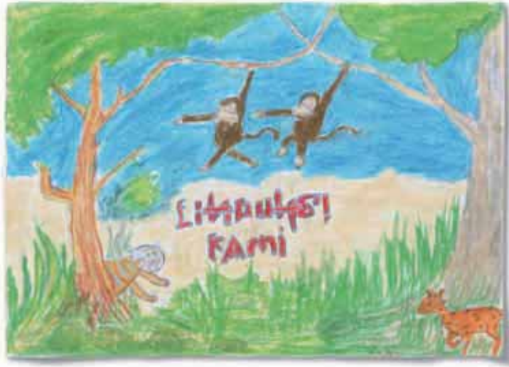
再生プロジェクトを行っているバリヤン地区の小学校の児童から贈られた絵。 「わたしたちを守って!」という動物たちのメッセージをこめて、描いてくれました。