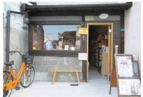
古民家を改装した古本屋『大吉堂』

自分自身で選び取ったものを、堂々と「好き」と言えるようになってほしい。自由に過ごせる『大吉堂』の空間の中には、こどもたちが自分らしく生きていくことへのエールが込められています。