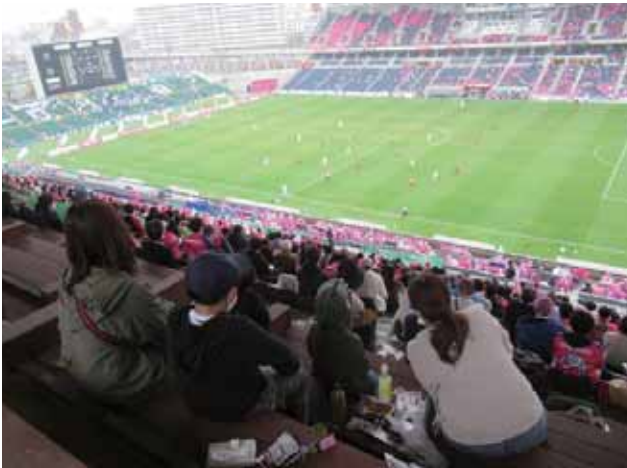
スタジアムで観るサッカーにドキドキ!

保護者からも「コロナ禍で外出が限られるなか、貴重な機会をありがとうございました」「大声を出さない、拍手での応援は新鮮でした」との感想が聞かれ、参加者の皆さんはとても良い表情をしていました。