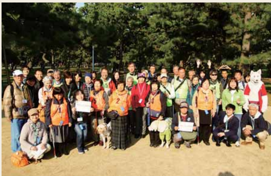
「クローバー」利用者の皆さんとボランティアたち

二年に一度ですが、毎回いろいろな趣向を凝らして開催しています。会場内を縁日風に演出してプラスチックの金魚すくい大会をしたり、屋外の公園では、履いたスリッパを飛ばして距離を競ったり。競技によってはボランティアメンバーもアイマスクを付けて、みんなが目の見えない状態でゲームを楽しみます。うちの交流会は面白いからと、皆さん、全国から泊りがけで来られるんですよ。」