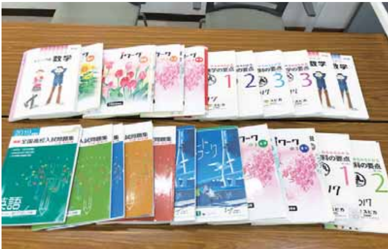
勉強したいことは生徒たちが自分で選びます

私は、2021年の春頃から「みんなで学ぶ教室」で学習支援のボランティア活動を始めました。以前から教員志望だったため塾講師のアルバイトもしていましたが、学習の環境が整った生徒が多く、学校が抱える問題とは向き合えていないのではないかなと思うようになりました。その時に大学の実習を通じて学習支援に興味を持ち、この教室と出会い活動させていただくことに決めました。 塾と同じように高校進学を目的としています。それに加えて自分の力で学習できるようにな