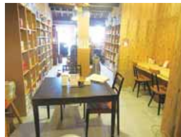
店内奥に設けられた「10代のヒミツキチ」

「居場所を10代に限定するつもりはないんです。でも、あえて10代と銘打たなければ、こどもと大人