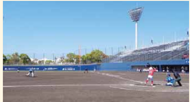
少年部の選手がバッターとして挑戦したエキシビジョンマッチ

開会式後には、昨年の天皇賜杯で4度目の全国制覇を果たした当金庫野球部が、球児たちの熱い視線のもと、模範演技を披露するとともに、少年部の選手が当金庫野球部を相手に打席に立ち、バッターとして挑戦するエキシビジョンマッチも行いました。