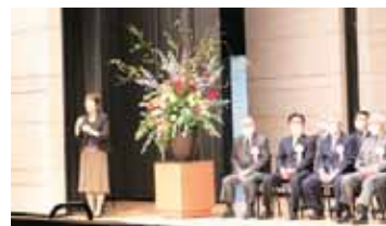
メンバーは、社会福祉大会の手話ボランティアとしても活躍