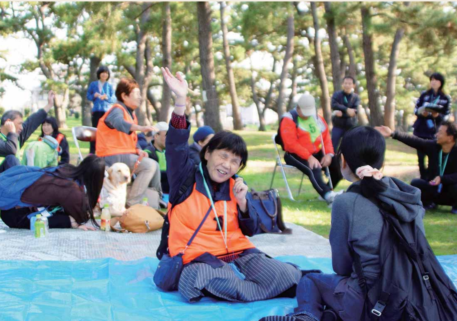
青空の下、利用者の笑顔が広がる交流会