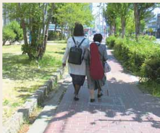
関西での同行依頼が全国から寄せられます

難しく考えず、その人の立場に立ち、その人の目の代わりをすることが、『フローバー』流の支援です。