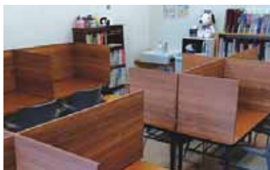
落ち着いて学習できる教室

ることを重視している教室の方針に魅力を感じています。「今日はこれを教えよう」と自分たちが決めておくのではなく、生徒たちが「今日はこの勉強をしたい」と言って課題を持ってきたり、教室にある問題集を使って復習したりと、生徒たち自身が勉強の内容を考えてきています。生徒たちが自分で学習を進められる力をもって教室を卒業してもらえらうに、これからもサポートしていきます。