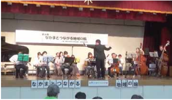
都島区自立支援協議会・障がい者部門のイベントでの演奏

『福祉の管弦楽団「まごころ」』(以下、まごころ)は、1991年に日本で最初に誕生した、社会貢献を目的としたオーケストラ。高齢者・障がい者福祉施設や、さまざまな団体が主催する福祉イベントへ赴き、出前コンサートを行っています。