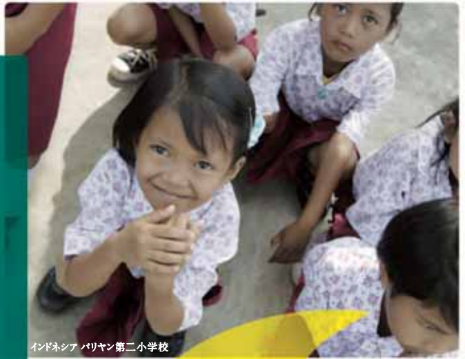
インドネシアバリヤン第二小学校