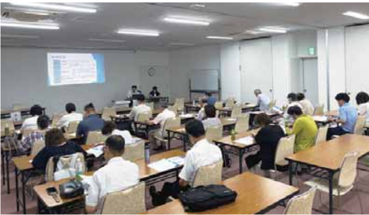
身近に起こり得る食中毒の説明を受け、驚きの声があがりました

り安心・安全に運営できるよう、各活動における衛生管理の重要性を改めて学ぶ機会として、登録団体やボランティア、そして、これから活動をはじめようと考えている人を対象に『衛生講習会』を毎年開催しています。