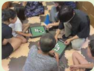
料理を待つ間に、みんなでわいわいオセロ中

新北野こども食堂はこどもたちの遊び相手ボランティアを募集しています。この記事を読んで興味を持った方は、活動に参加してみたいかがでしょうか?