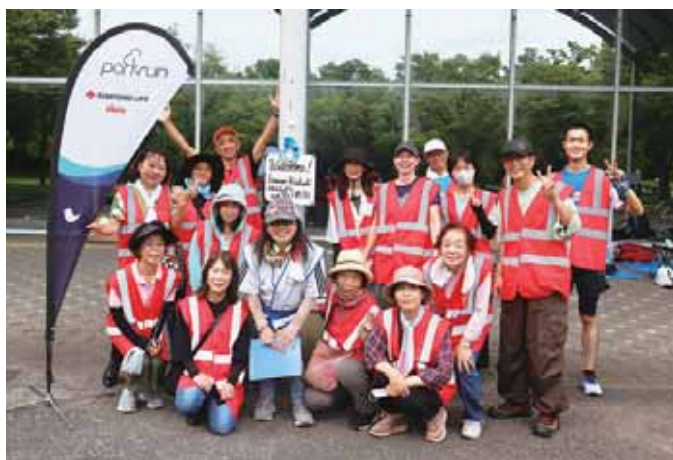
いつも和気あいあい! ボランティアの皆さん

「今日は気温・湿度が高いので、無理のない走り方で楽しんでください」とアナウンスされ、およそ70人が参加しての『parkrun』がスタートしました。鶴見緑地公園の『parkrun』は、2.5キロ×2周のコース。スタッフたちが声援を送りながら見守り、ランナーがゴールするたび