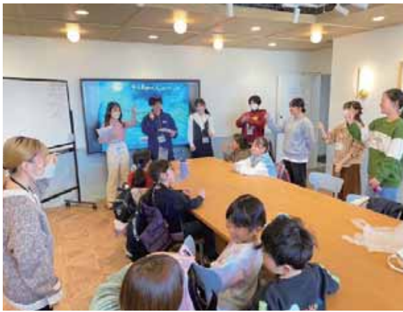
子どもたちが楽しめるワークショップを企画