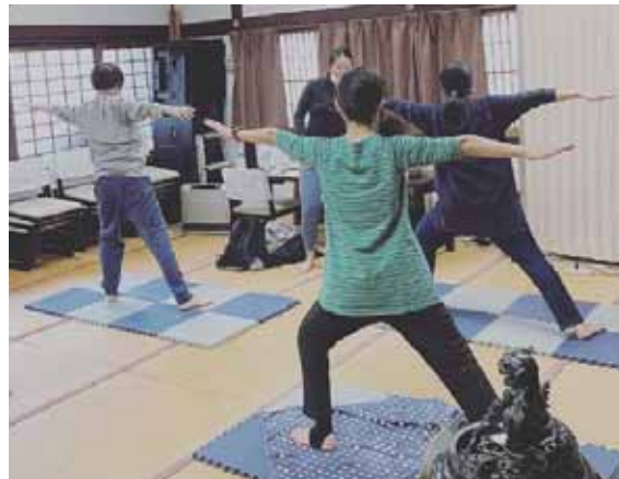
『ココカラYOGA』には、幅広い世代の人たちが参加