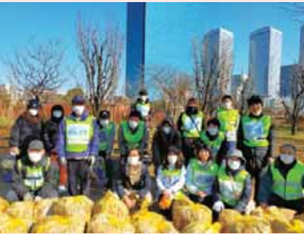
「城見緑道公園愛護会」の皆さん

も始まりました。活動に参加しているのは、日頃から大阪城公園を散歩している人や、近隣のビジネス街で働く人たち。およそ1時間の活動後には、近くのコーヒーショップで自由参加の親睦会を開くこともあります。また、夏休みや冬休みの期間中には、活動に参加する高校生や大学生も少なくありません。