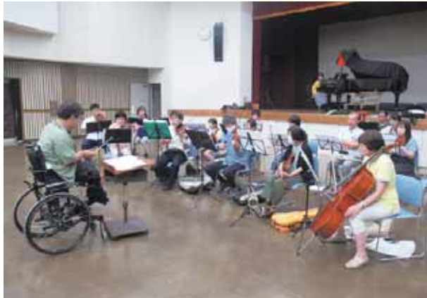
国内で活躍中のプロ指揮者もボランティアで活動(練習風景)

現在、『まごころ』の登録団員は53人。小・中学生から高校・大学生、社会人、シニア世代まで、障がいのある人となない人が一緒に演奏を楽しんでいます。耳が聞こえない人にも音楽を