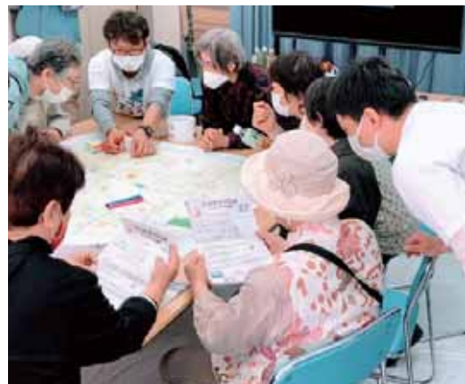
みんなでワイワイ、歩いたルートの地図づくり

そして歩き終えた後には、みんなで地図づくりのグループワーク。大きな白地図を広げて囲み、その日気付いたことや、自分のおすすめのお店やスポットを書き込みながら、「今度はいつ歩く?」と、話が盛り上がっています。