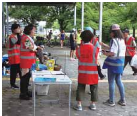
それぞれの担当場所でスタート前の準備

『parkrun』の魅力は、老若男女、ベビーカーに乗った赤ちゃんや愛犬も一緒に、誰でも参加できること。登録してIDを取得すれば、いつでも、ど