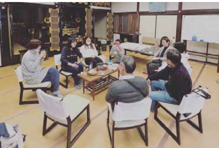
お茶を飲みながらの談笑も楽しい『ココカラ相談所』

ために取り組んでいるのが『社会的処方』の試みです。『社会的処方』とは、従来の医療のみでは解決が難しい問題に対して、薬ではなく『地域や人とのつながり』を処方して、生活面から改善していくという考え方です。