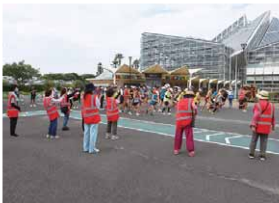
声援を受けながら、ランナーがいっせいにスタート!

この会場でも参加でき、世界中を旅行しながら『parkrun』を楽しむ人も少なくありません。また、この会場もボランティアによって運営されており、ボランティアの皆さんにとっても、自分たちでさまざまな工夫をしながらイベントを盛り上げることができ、楽しく、やりがいのある活動です。